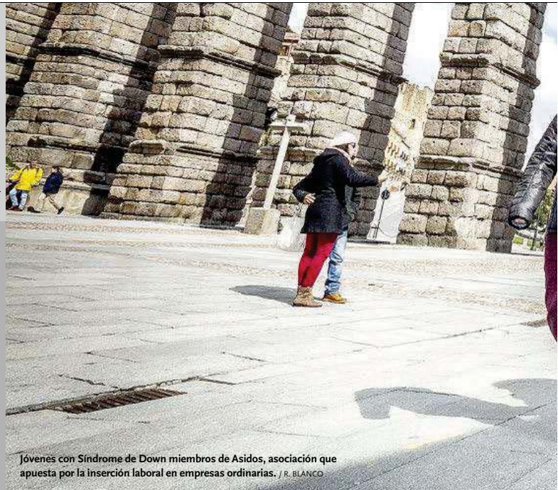
Jóvenes con Síndrome de Down miembros de Asidos, asociación que apuesta por la inserción laboral en empresas ordinarias.