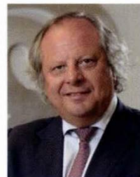
Miguel Mirones Presidente Instituto para la Calidad Turística Española (ICTE)