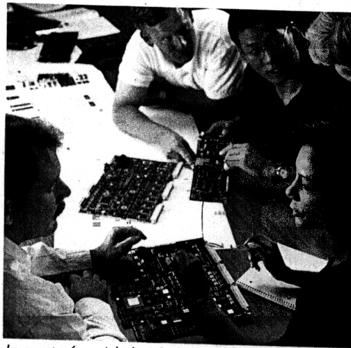
La economía social da trabajo a un millón de personas, un 7% de los asalariados, y cerca del 10% si se suma el trabajo voluntario.