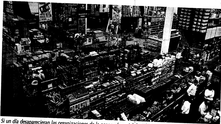
Si un día desaparecieran las organizaciones de la economía social, la Administración pública debería crear 320.000 empleos para suplirlos.

bilidad que les sitúa en una posición estratégica relevante para encarar, de forma complementaria, algunos de los problemas básicos de las sociedades avanzadas. Una vía renovada capaz de reconciliar la economía con la sociedad, haciendo facti-