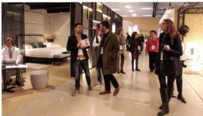
En el marco de InteriHOTEL se generan contenidos de valor para prescriptores, propietarios de hotel y directores de proyectos de cadenas hoteleras

L a próxima edición de InteriHOTEL Barcelona, organizada por Cenfim, contará con 200 marcas expositoras especializadas en contract e interiorismo hotelero y prevé la asistencia de 4.000 visitantes profesionales (hoteleros, arquitectos, interioristas, decoradores y otros prescriptores), así como la detección de 1.200 proyectos hoteleros de reforma o nueva construcción.