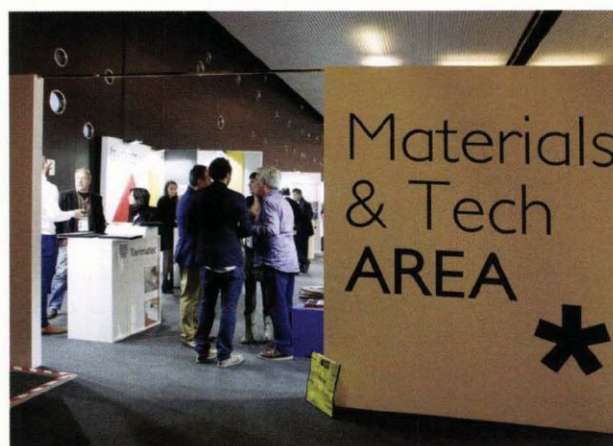
Asisten empresas que ofrecen un servicio integral llave en mano y de productos específicos para el interiorismo hotelero

Además, se prevé una importante participación de marcas expositoras internacionales y un incremento del número total de visitantes de fuera de nuestras fronteras.