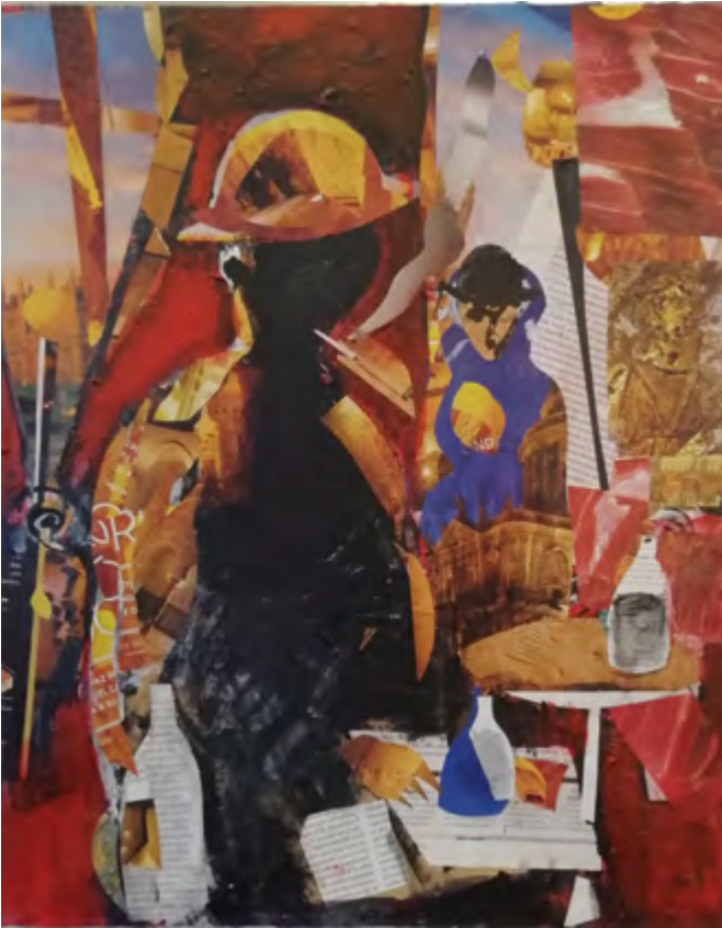
Fumador interior. 2015-19 Collage 40 x 50 cm