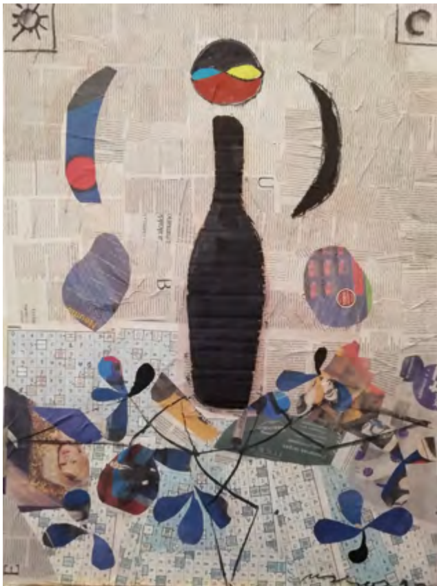
La botella negra. 2015-19