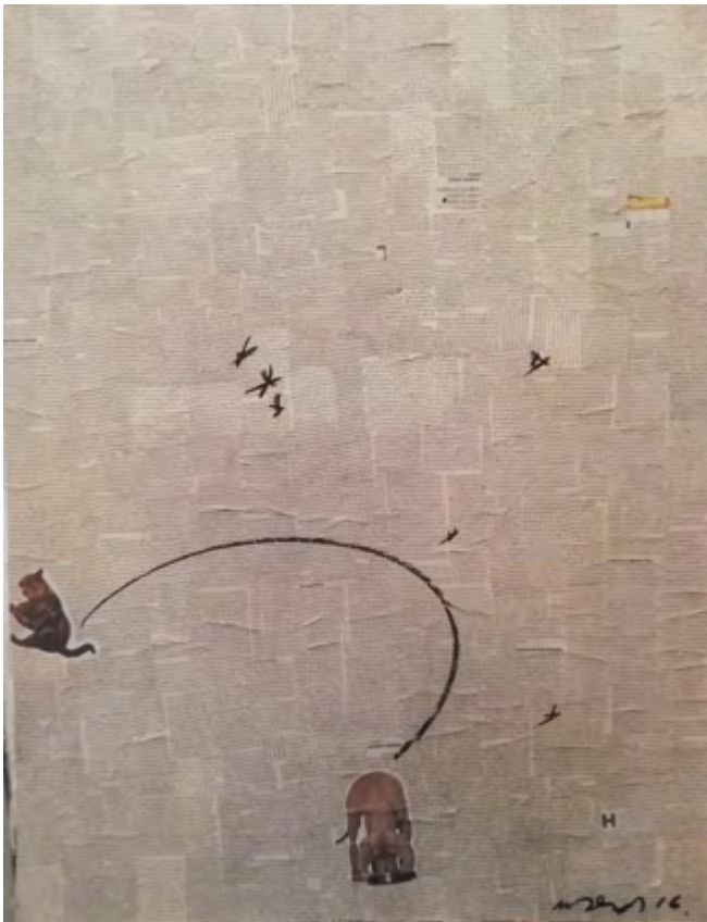
Ladrido. 2015-19 Collage 60 x 80 cm