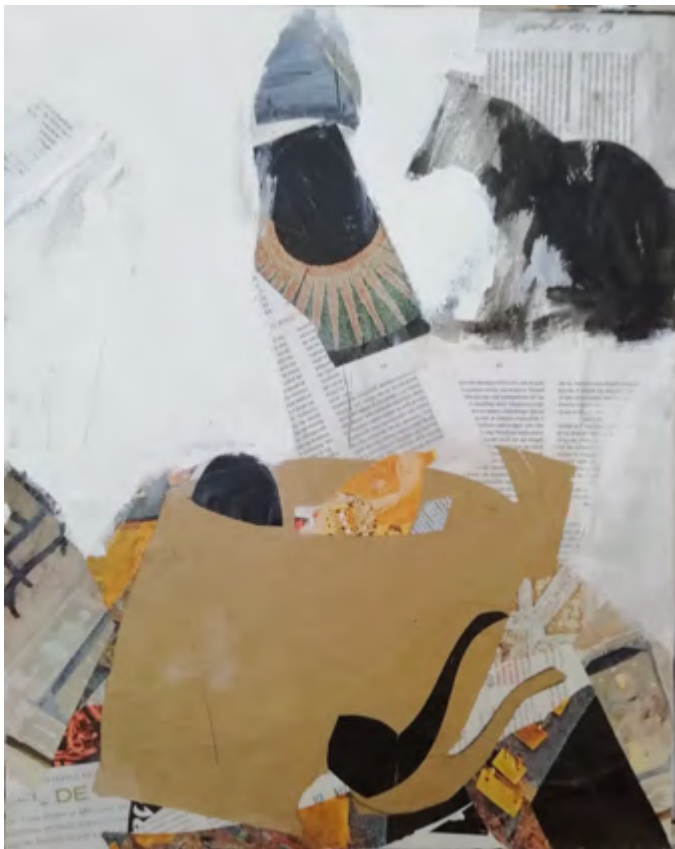
Pipa . 2015-19 Collage 40 x 50 cm