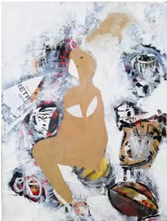
Figura más textura. 2015-19