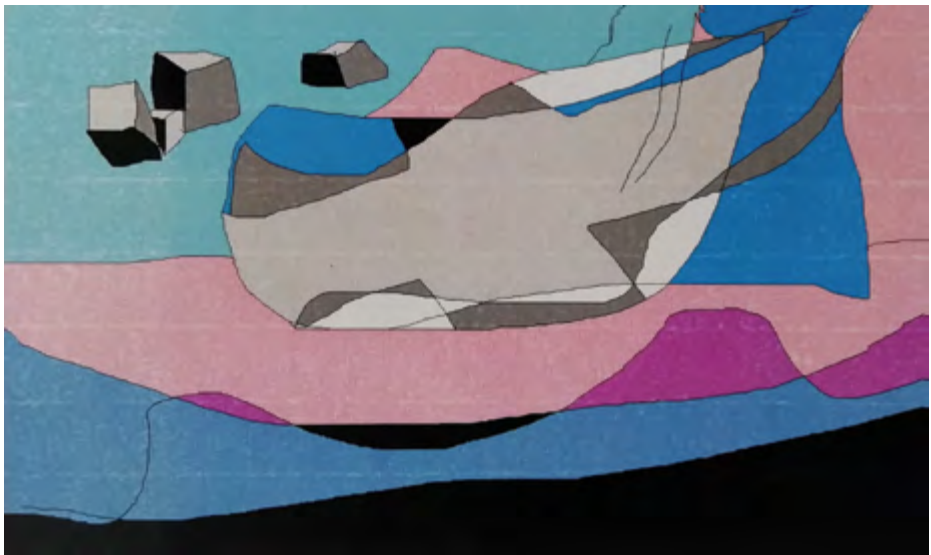
Sad day. 2014 Infografia 40 x 30 cm