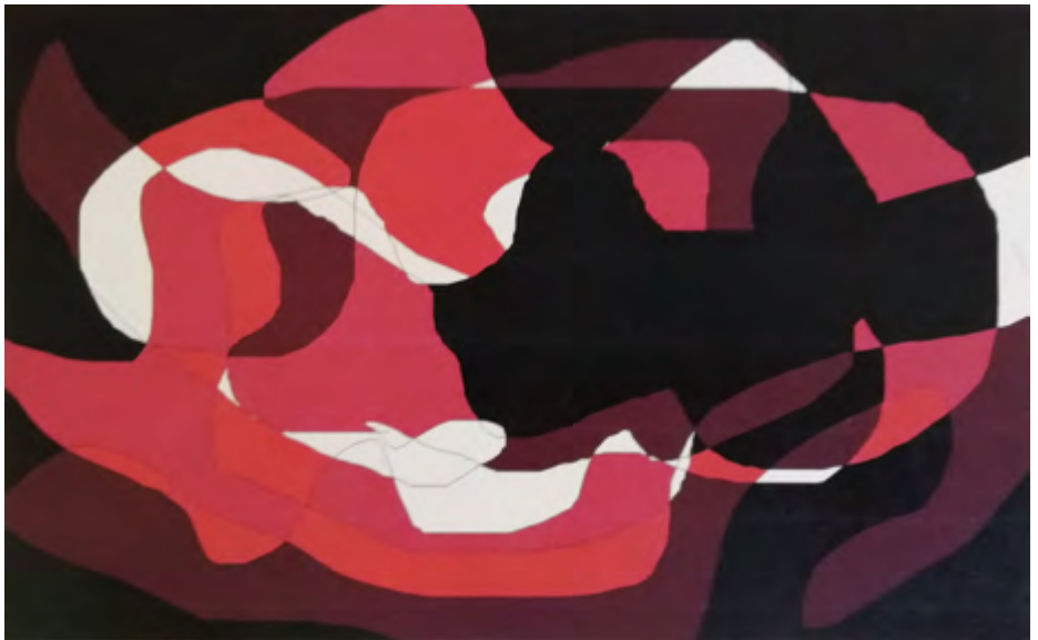
Cuarto Curvo. 2015-19 Infografía 40 x 30 cm