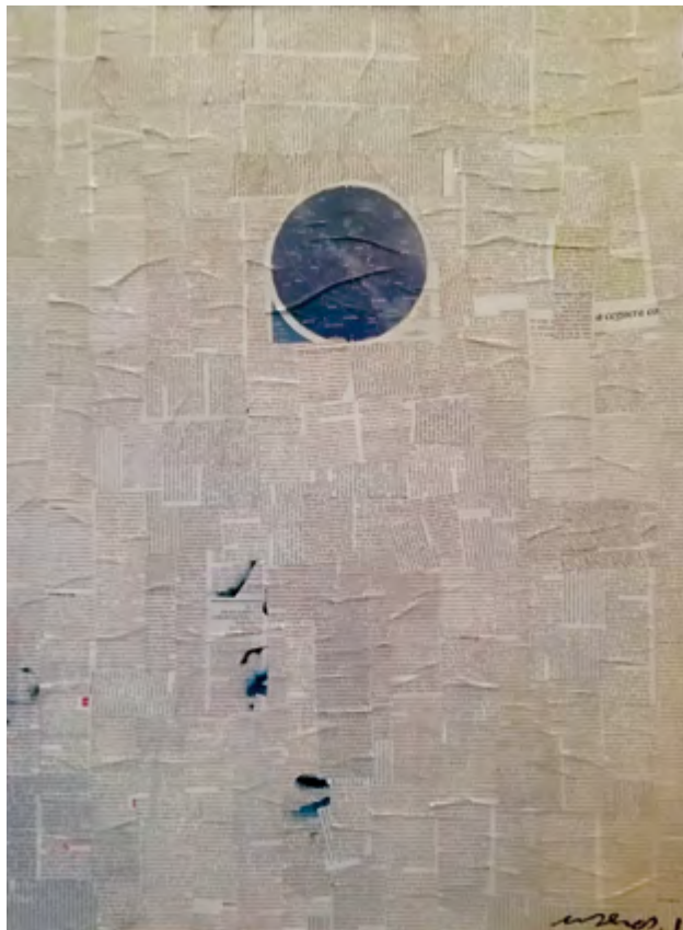
Esfera. 2015-19 Collage 60 x 80 cm