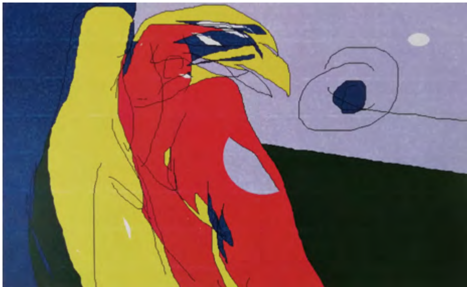
Estéreo. 2014 Infografía 40 x 30 cm