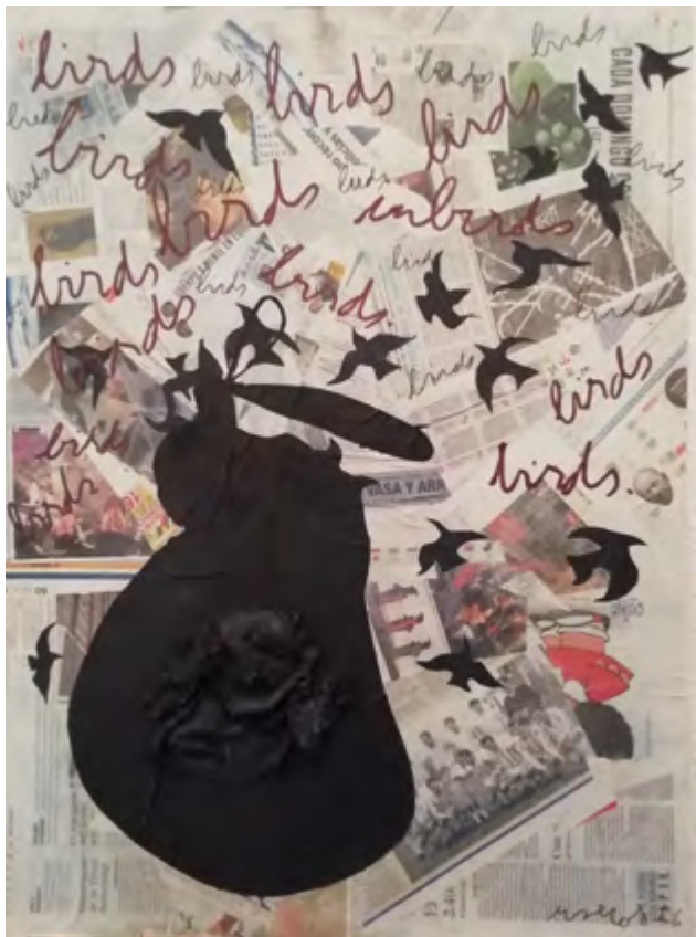
Birds . 2015-19 Collage 60 x 80 cm