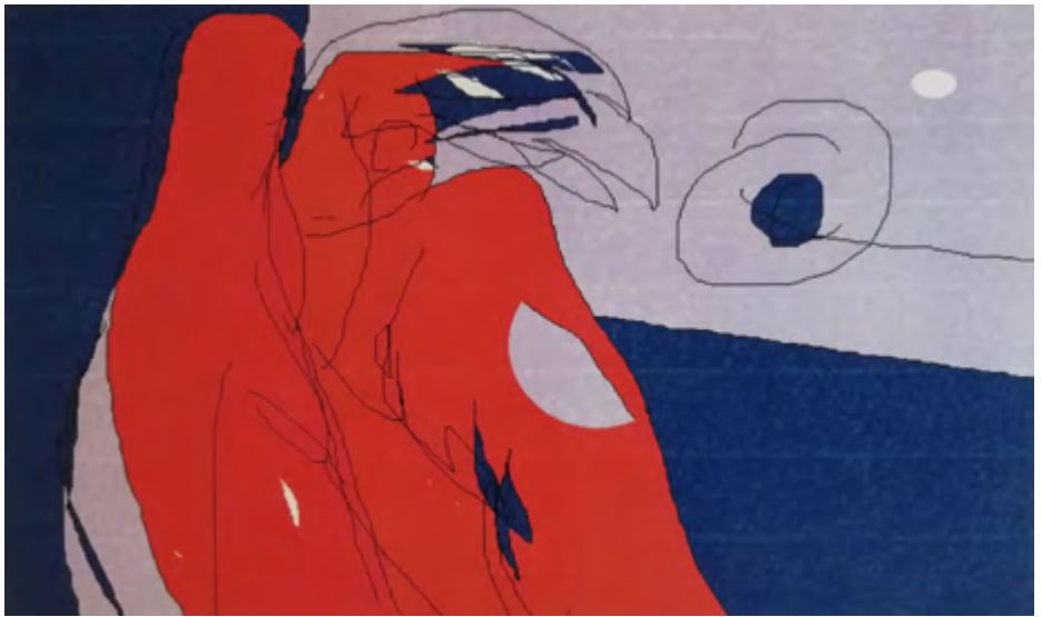
Serafin . 2015-19 Infografía 40 x 30 cm