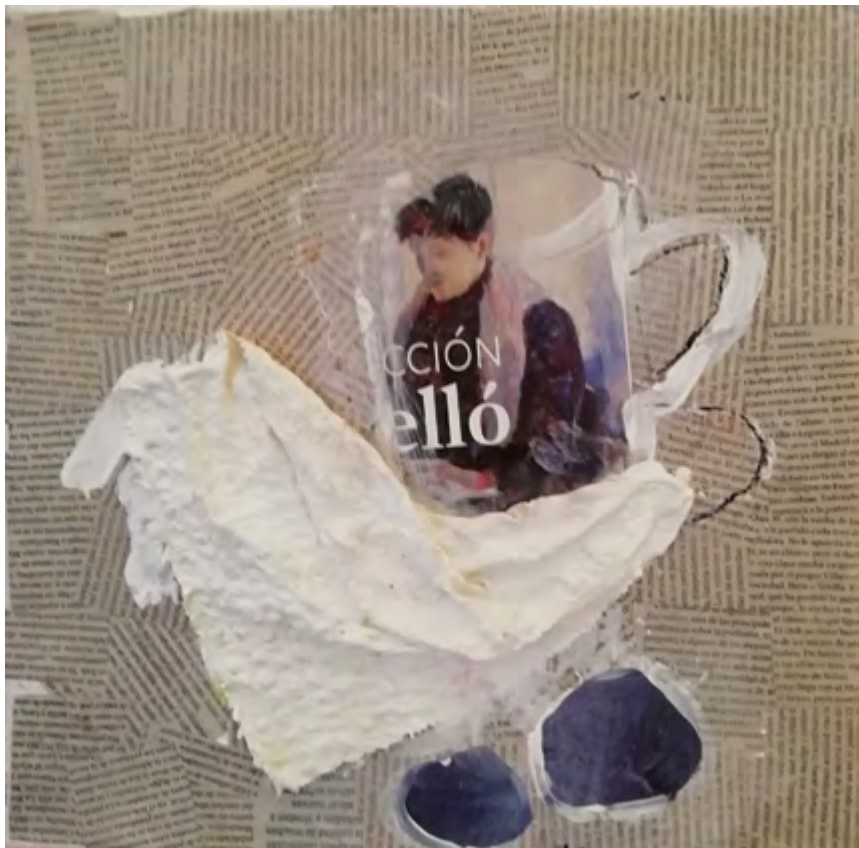
Taza y trapo. 2015-19 Collage 30 x 30 cm