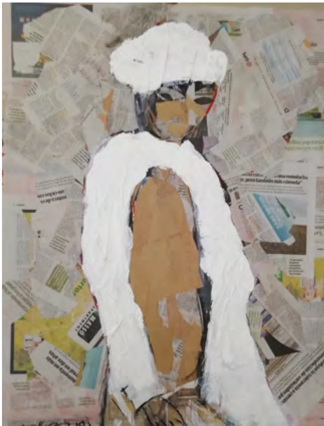
Figura de collage. 2015-19