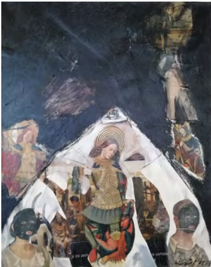
Arcángel. 2015-19 Collage 40 x 50 cm