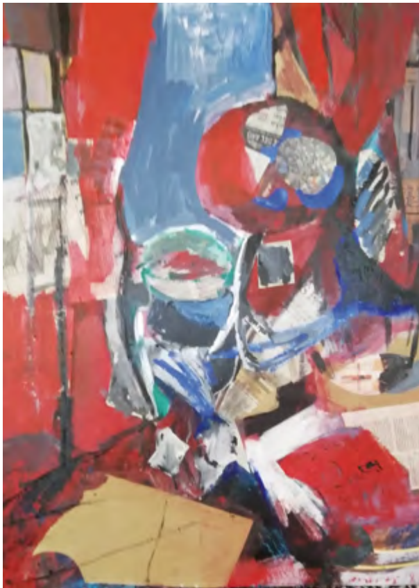
Interior rojo con mesa. 2015-19 Collage 60 x 80 cm