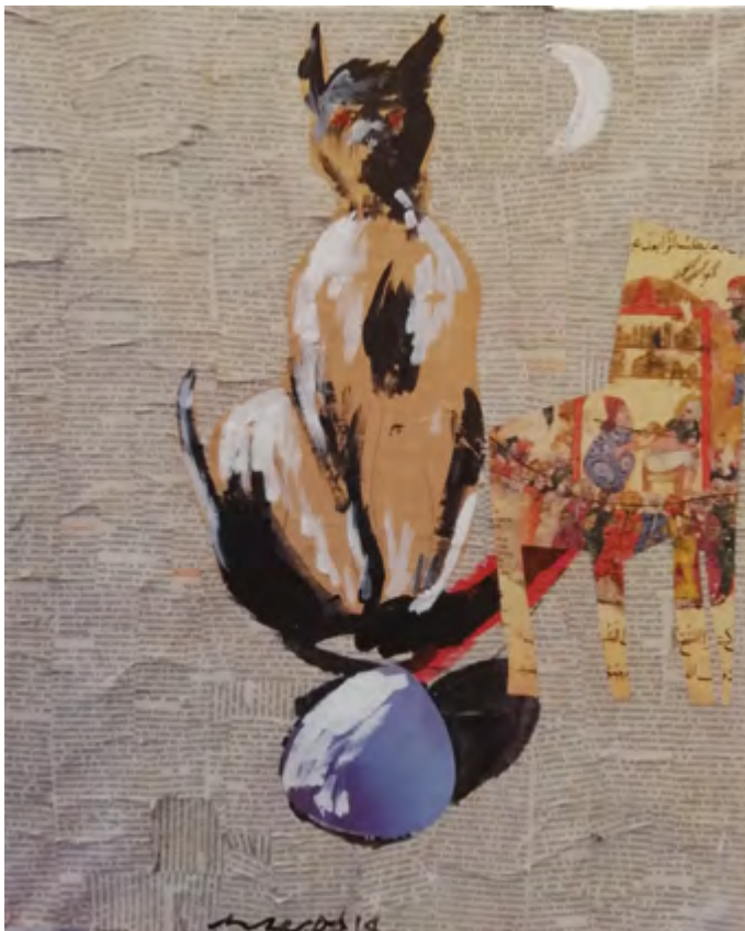
Gato y silla. 2015-19 Collage 40 x 50 cm