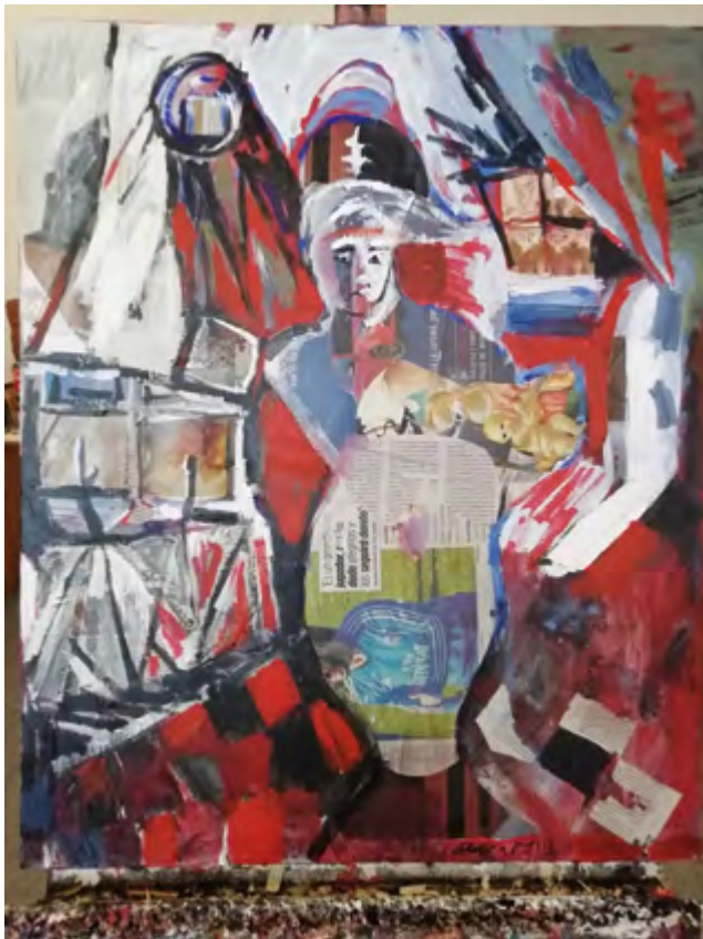
Figura en rojo y negro. 2015-19 Collage 60 x 73 cm