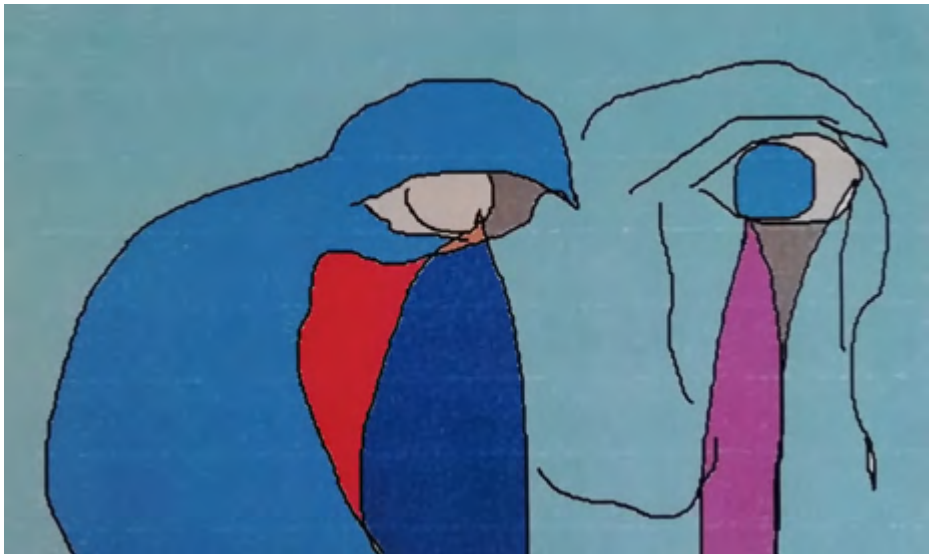
Observador. 2014 Infografía 40 x 30 cm