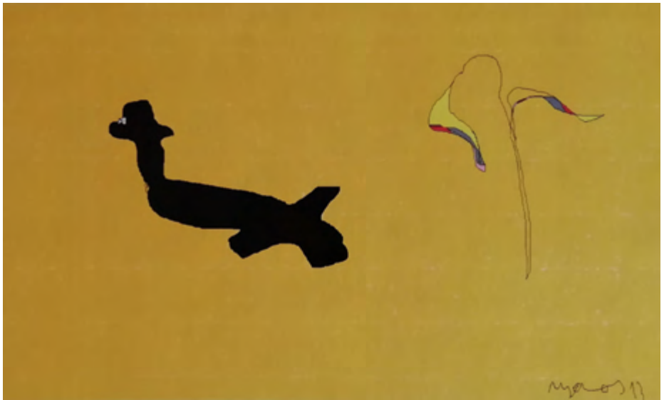
Hora cero. 2014 Infografía 40 x 30 cm