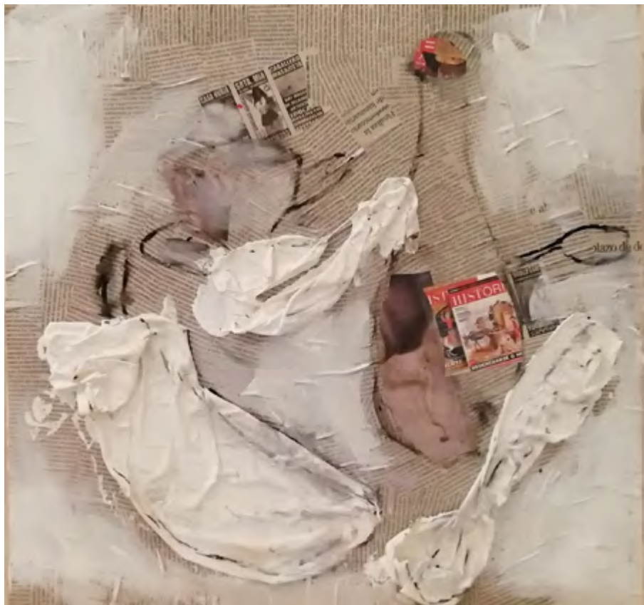
Bodegón con trapo. 2015-19