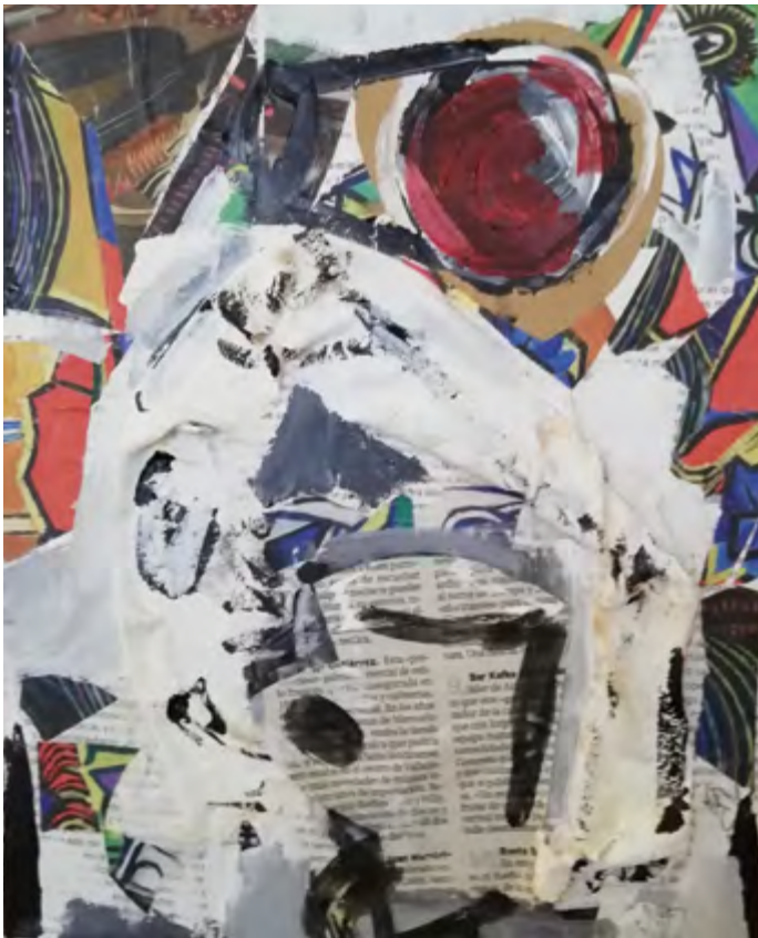
Taza y color. 2015-19 Collage 24 x 30 cm