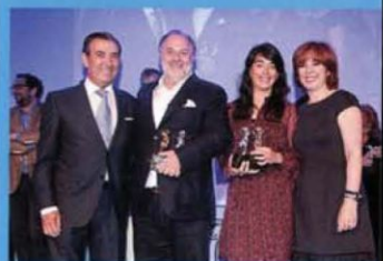
2014: Campofrio y McCann, premiados por 'Hazte extranjero'.