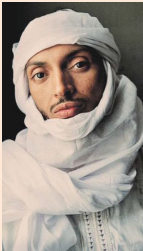
El Centro Botín organiza un concierto de Bombino, compositor de Níger, el 8 de octubre en Santander.

Apoyando un cambio en el modelo energético. Fundación Iberdrola apuesta por la investigación para contribuir a la actividad investigadora en el terreno de la energía, mediante varios programas de becas y ayudas dirigidos a jóvenes. - También por la biodiversidad para contribuir a la protección del medio ambiente y por el desarrollo cultural. La cooperación internacional con los sectores más vulnerables, especialmente con la infancia y la juventud, es otra de las apuestas de la fundación.